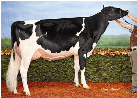
RALMA-RH MANOMAN BANJO FIFTH DAM